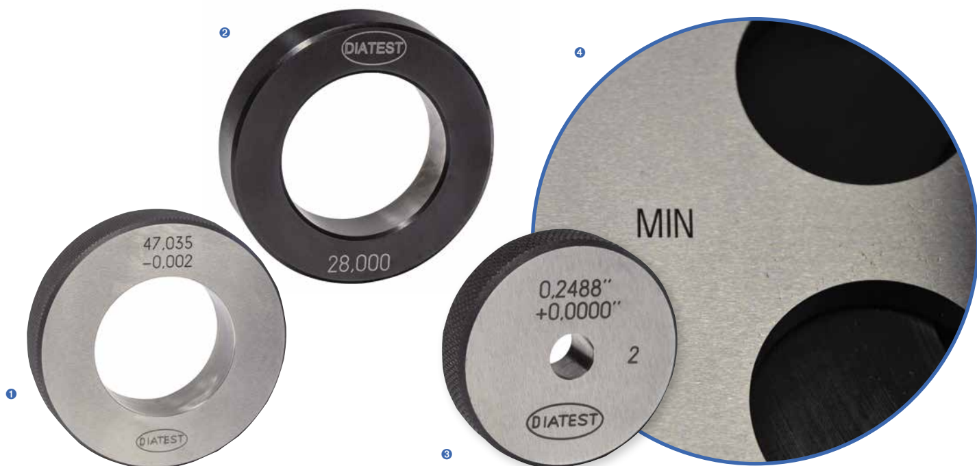
1 DIN Einstellring metrisch DIN metrical setting ring 2 DIATEST Einstellring DIATEST setting ring 3 DIN Einstellring Inch DIN Setting master Inch 4 Beispiel für Sonder-Einstellmeister Example for special setting master

Special Setting masters for specific measuring tasks on request